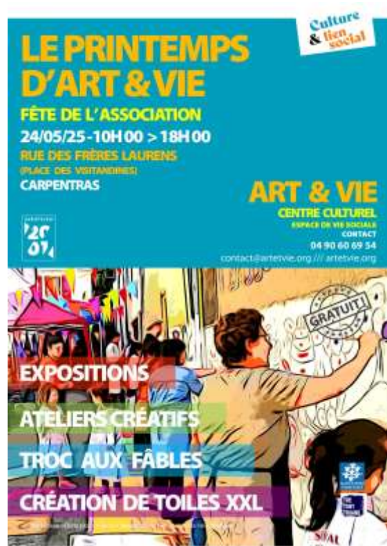
> PRINTEMPS D'ART & VIE Le 24 MAI 2025 10h00 > 18h00 Rue des frères Laurens / CARPENTRAS