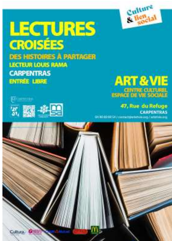
< LECTURE Louis RAMA Le 18 MAI 2025 à 18h00 Rue du Refuge / CARPENTRAS