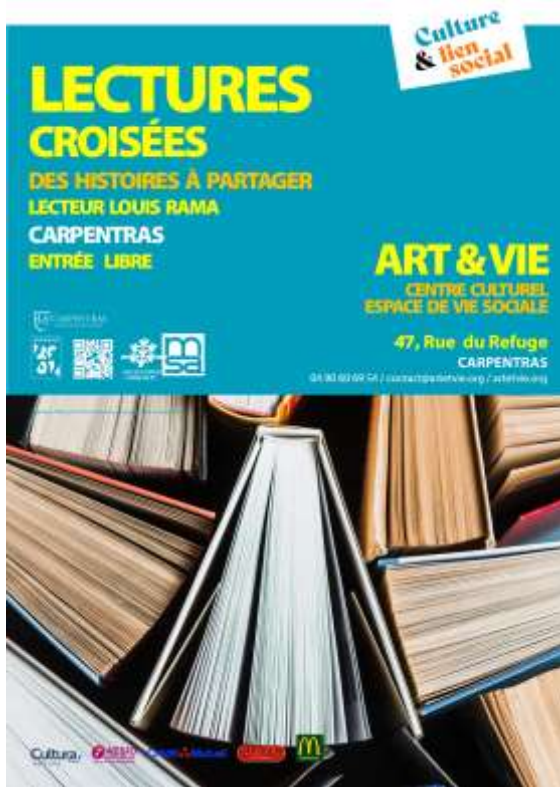
< LECTURE Louis RAMA Le 18 MAI 2025 à 18h00 Rue du Refuge / CARPENTRAS