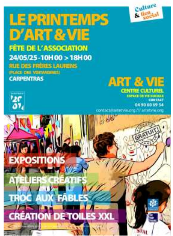
> PRINTEMPS D'ART & VIE Le 24 MAI 2025 10h00 > 18h00 Rue des frères Laurens / CARPENTRAS